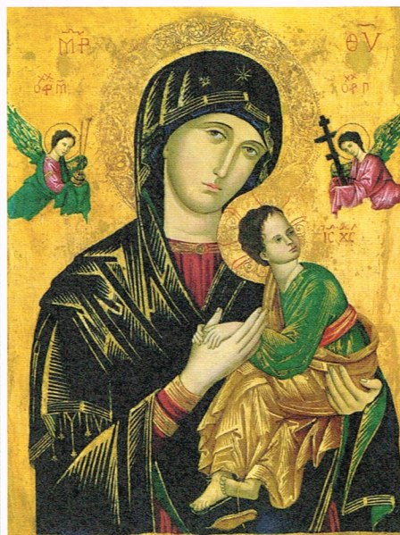
Nuestra Señora del Perpetuo Socorro

Incluso los amigos y los discípulos de Jesús llegaron a presentar sus problemas a María, confiando en la cercanía que ella tenía con su Hijo. En las bodas de Caná, María interviene para ayudar cuando el vino se está acabando. Con todo, María recuerda a los discípulos que tienen que hacer lo que Jesús les pida (Juan 2:5). María incluso estuvo con los discípulos cuando esperaban la venida del Espíritu Santo (Hechos 1:14). Este tipo de hechos cobra mayor relevancia cuando entendemos que, en tiempos de Jesús, las mujeres tenían muy poca participación en la vida social.