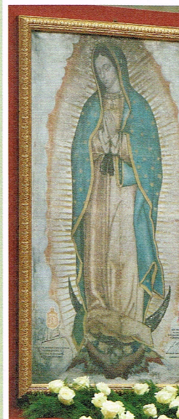
Nuestra Señora de Guadalupe

La Iglesia primitiva honraba a María. Los Evangelios, escritos durante el siglo posterior a la muerte y resurrección de Jesús, expresan el pensamiento de la Iglesia de aquellos años. Ya en el año 150, los artistas cristianos comenzaron a hacer imágenes de María cargando al niño Jesús. La devoción de la Iglesia Católica por María está profundamente enraizada en nuestra tradición.