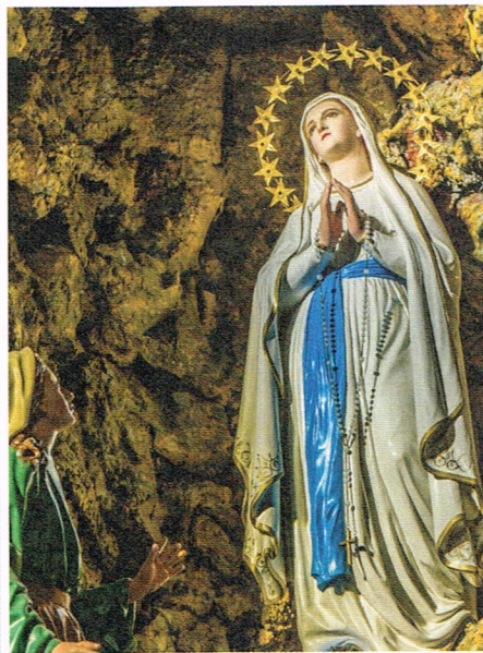
Nuestra Señora de Lourdes

imágenes de María, que les ayuden a reflexionar en su santidad y en su vida pura y humilde. Al hacer esto, no pretendemos adorar a María, más bien nos volvemos a ella para encontrar inspiración. María nos recuerda que simplemente con decir "sí" traemos al mundo a Cristo.