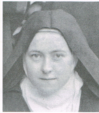
Santa Teresa de Lisieux

Es algo parecido a las personas que conservan fotografías u objetos que les recuerdan a sus seres queridos: no le rinden culto ni a los objetos ni a las personas. Contemplar una estatua de Santa Teresita de Lisieux, cuya mamá