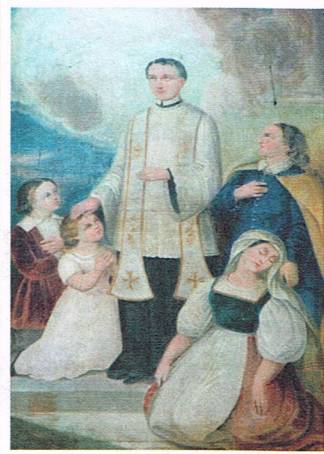
San Juan Bosco

murió cuando era chica, puede ayudarnos a sentirnos menos solos cuando hemos perdido a un ser querido. Una imagen de san Francisco de Asís puede recordarnos el amor a la creación de Dios y hacernos más conscientes del problema ambiental.