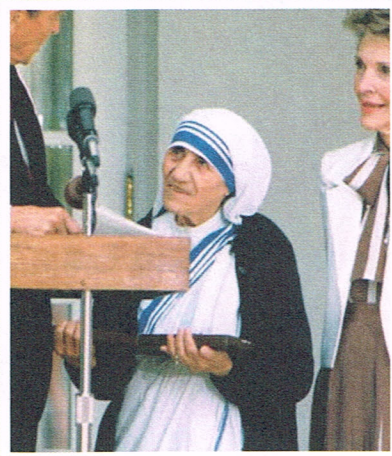
Santa Madre Theresa

su hijo se convirtiera al Cristianismo, muchas personas le piden a ella su intercesión si tienen dificultad para perseverar en la oración. Las oraciones de santa Mónica al final fueron escuchados: su hijo, Agustín, llegó a ser santo y doctor de la Iglesia.